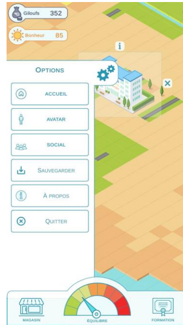
Trois illustrations dans différentes phases de jeu de l'application JenDo-City (Gilles Aldon CC BY-NC-SA)