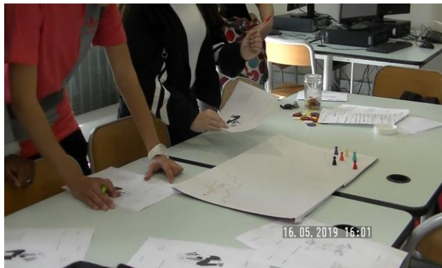
Une première expérimentation avec papier et pions

La réalisation du jeu a été conçue dans une perspective de recherche orientée par la conception (Sanchez & Monod-Ansaldi, 2015), dans des cycles successifs de conceptions, de réflexions et de développement.